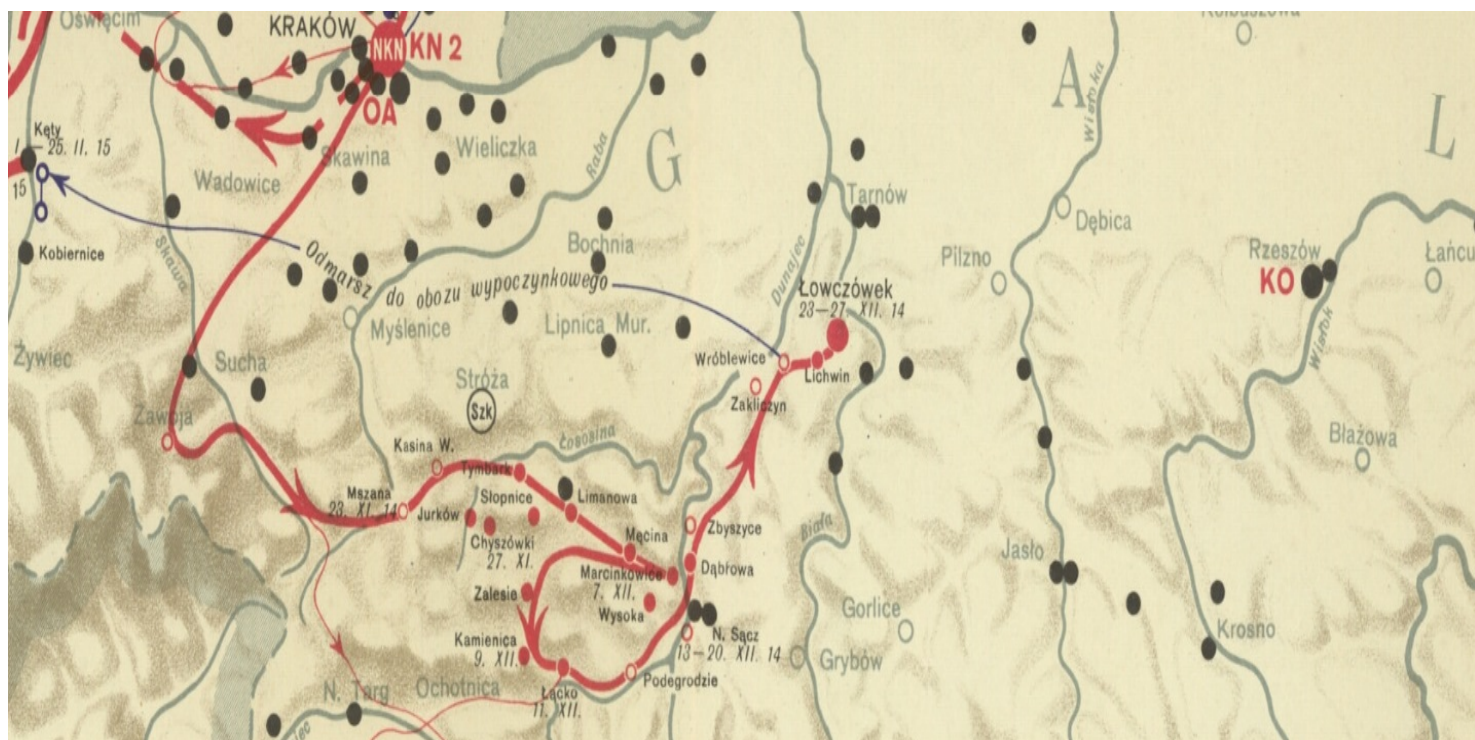
Mapa Szlakiem Legionów w opracowaniu Teofila Szumańskiego, Lwów 1934 r.

https://przystanekhistoria.pl/pa2/tematy/jozef-pilsudski/61005,Lowczówek-krwawa-Wigilia-Pierwszej-Brygady.html