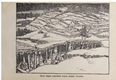
Ilustracja z książki Boje legionistów polskich. Bitwa pod Łowczówkiem, Piotrków 1916.

I wtedy okazuje się, że wcześniejszy rozkaz jest pomyłką sztabu Pattaya. Polacy wracają, ale ich okopy są już zajęte przez Rosjan. W twarz dostają karabinowe salwy. A więc bagnety na broń i szturm. Nieprzyjaciel wyparty. Znowu zajmują umocnienia na wzgórzu 360, pozycje które dają strategiczną przewagę. Rosjanie usuwają się gdzieś w pobliże. Zapada ciemność. Walka dogasa. Następuje jakieś nieformalne zawieszenie broni. Wtedy właśnie dochodzi do sytuacji niezwyklej.