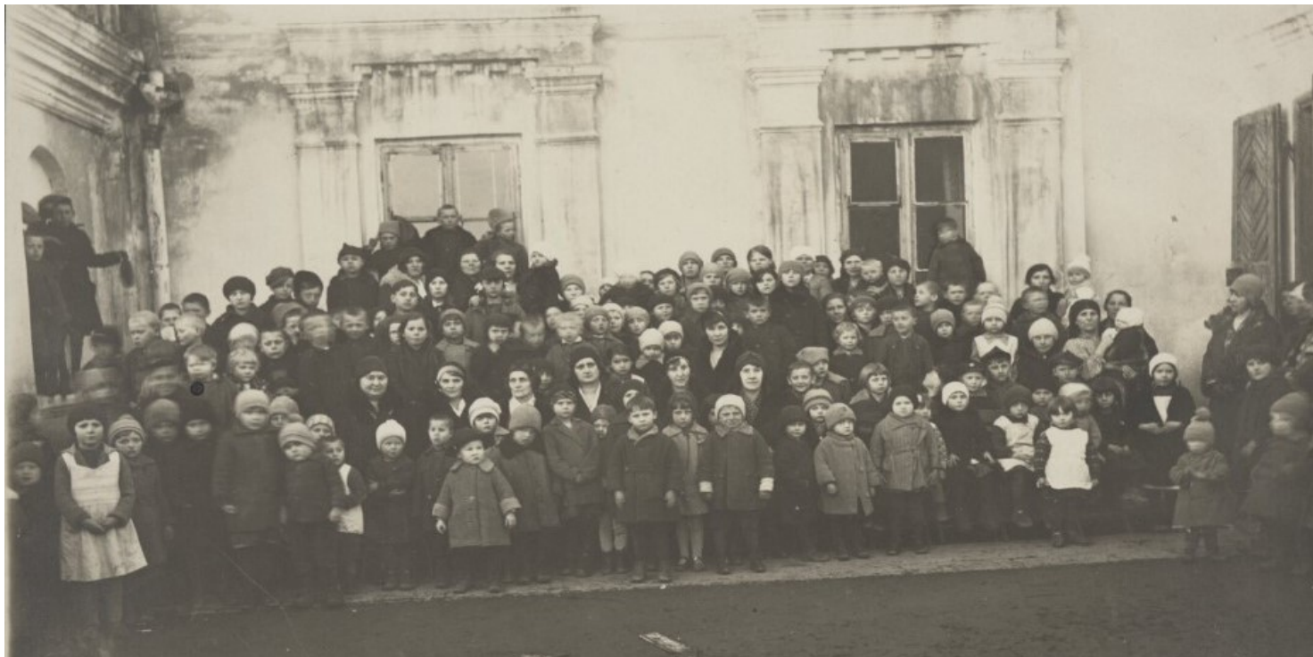
Dziatewa Sieradza zgromadzona na podwieczorku urzadzonym przez Zwiqzek Pracy Obywatelskiej Kobiet z okazji imienin Marszalka Polski Jozefa Pilsudskiego, 24 marca 1931 r.

https://przystanekhistoria.pl/pa2/tematy/jozef-pilsudski/64215,Najwazniejszy-dzien-dla-pilsudczykow-Rzecz-o-i-mieninach-Pierwszego-Marszalka-Pol.html