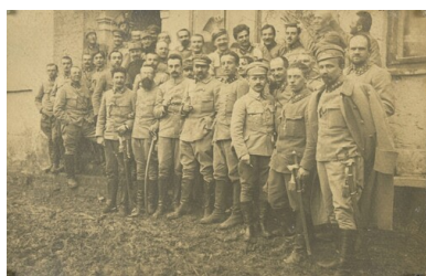
Grudzyny, 19 marca 1915: imieniny Józefa Piłsudskiego.

Podczas służby na Wołyniu w 1916 roku Brygadier był już tak znany, że z okazji imienin Piłsudskiego organizowano uroczyste akademie, poranki, wydawano okolicznościowe druki, pocztówki, przemówienia Komendanta, rozkazy okolicznościowe i inne publikacje. Uroczystości imieninowe przygotowano w różnych miejscowościach, np. w Krakowie zorganizowano spotkanie, na którym odczyt o Komendancie I Brygady wygłosił Andrzej Strug. Solenizant obdarowany został przez wiernych sobie żołnierzy szablą oraz ryngrafem z Matką Boską Ostrobramską. Od żołnierzy 5. pułku piechoty otrzymał statuetkę legionisty autorstwa Włodzimierza Koniecznego.