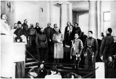
Otwarcie Sejmu Ustawodawczego w Warszawie. Widoczny m.in. naczelnik państwa Józef Piłsudski, 10 lutego 1919 r.

W magdeburskiej twierdzy Piłsudski doczekał końca wojny. Od listopada 1918 roku po powrocie do stolicy stanął przed zgołą innymi wyzwaniami. Jemu to – jako Naczelnikowi Państwa i zarazem Naczelnemu Wodzowi – przypadła wiodąca rola we wznoszeniu państwowego gmachu odradzającej się Rzeczypospolitej. To właśnie Piłsudski, a nie jakikolwiek inny polityk, wziął na siebie odpowiedzialność za wybór priorytetów, tak w sprawach wewnętrznych, jak przede wszystkim związanych z wytyczaniem granic. Jego droga do Niepodległej nie dobiegła zatem kresu. Wprawdzie wywalczył wolną, niepodległą Polskę, ale na tym nie poprzestał, gdyż potrafił wykuć optymalne w powojennych realiach granice państwa i zbudować jego nowoczesne podwaliny ustrojowe.