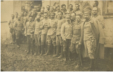
Grudziny, 19 marca 1915 r. imieniny Józefa Piłsudskiego.