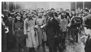
Józef Piłsudski na dworcu w Warszawie 12 grudnia 1916 r. Zdjęcie bywa błędnie łączone z dniem 10 listopada 1918 r.

Od tego momentu Komendant, posługując się nader wątpliwymi atutami, czyli „sfinksowatym” Królestwem i „nieposłusznymi” Legionami, usiłował wymusić na politykach kierujących państwami centralnymi korzystne dla sprawy polskiej rozstrzygnięcia, przy czym licytacyjna idea sprowadzać się miała do podnoszenia coraz to nowych żądań w miarę ich stopniowej realizacji. Przy czym owe „nieposłuszne” Legiony zyskały miano najlepszego wojska walczącego na wschodnim froncie, co w szczególny sposób potwierdziły zmagania, toczony w lipcu 1916 r. pod Kostiuchnówką.