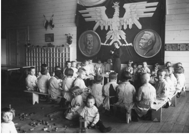
Przedszkole Rodziny Kolejowej w Radomiu, ok 1935 r.