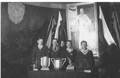
Członkowie patrolu Związku Rezerwistów RP z Wisły obok

„Niechże więc ta Wszechnica, którą dziś tu otwieram, zgodnie z tradycją tej ziemi nie ziele nigdy jadem nienawiści, niech nie kroczy nigdy drogami, które dla nas Polaków, tak ciężkimi były. Niech krzepi jasnowidztwem wiedzy, potęgą myśli twórczej, umiejętną i skrzętną pracą naukowego rzemiosła”.