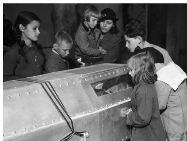
Dzieci przy sarkofagu marszałka Józefa Piłsudskiego w krypcie św. Leonarda na Wawelu, 1935 r.

jednoznacznie określa skuteczność Józefa Piłsudskiego jako wychowawcy.