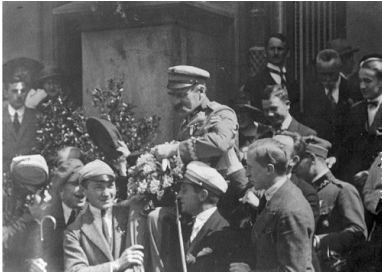
Józef Piłsudski niesiony na rękach przez studentów Uniwersytetu Jagiellońskiego przed budynkiem Collegium Novum, 1921 r.