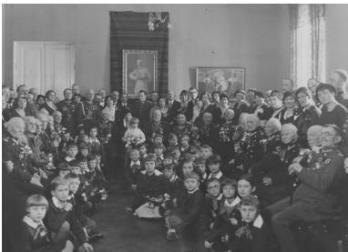
Spotkanie dzieci z weteranami powstania styczniowego. Wśród uczestników uroczystości z okazji 70. rocznicy insurekcji widoczni m.in.: Aleksandra Piłsudska i Edward Rydz-Śmigły, 1933 r.

Po powrocie z wygnania w 1892 roku najpierw w Wilnie, a następnie w kolejnych miastach, już dojrzały psychicznie i ideowo Piłsudski rzucił się w wir działalności politycznej w szeregach Polskiej Partii Socjalistycznej. Redagował, drukował i kolportował „Robotnika”, organizował odczyty i spotkania, walczył o wpływy w PPS, odbywał podróże zagraniczne, a we wrześniu w 1909 roku dowodził akcją w Bezdanach, podczas której z wagonu pocztowego zarekwirowano 200 tys. rubli. Przeznaczone zostały one na działalność Organizacji Bojowej PPS, a także organizacji, które po wybuchu I wojny światowej stanowiły zaplecze kadrowe i szkoleniowe dla Legionów i Wojska Polskiego: Związku Walki Czynnej, Związku Strzeleckiego, Towarzystwa „Strzelec”, Polskiej Organizacji Wojskowej.