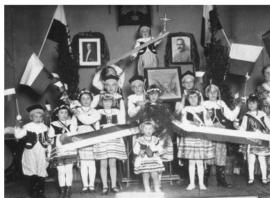
Grupa polskich dzieci w Szczecinie, 1930 r.

„Z całego odczytu Komendanta te jego słowa pozostały mi w pamięci na całe życie. Jeszcze widzę Jego głowę, Jego oczy i Jego śmiech serdeczny, gdy woła »ratuj się, kto może«. Nieraz w życiu, w momentach ciężkich dla kraju dla bliskich, dla siebie samej - słyszałam Jego głos »ratuj się, kto może«, nakazujący ruch i walkę przeciw wszystkim i przeciw wszystkiemu, bez oglądania się na niebezpieczeństwo”.