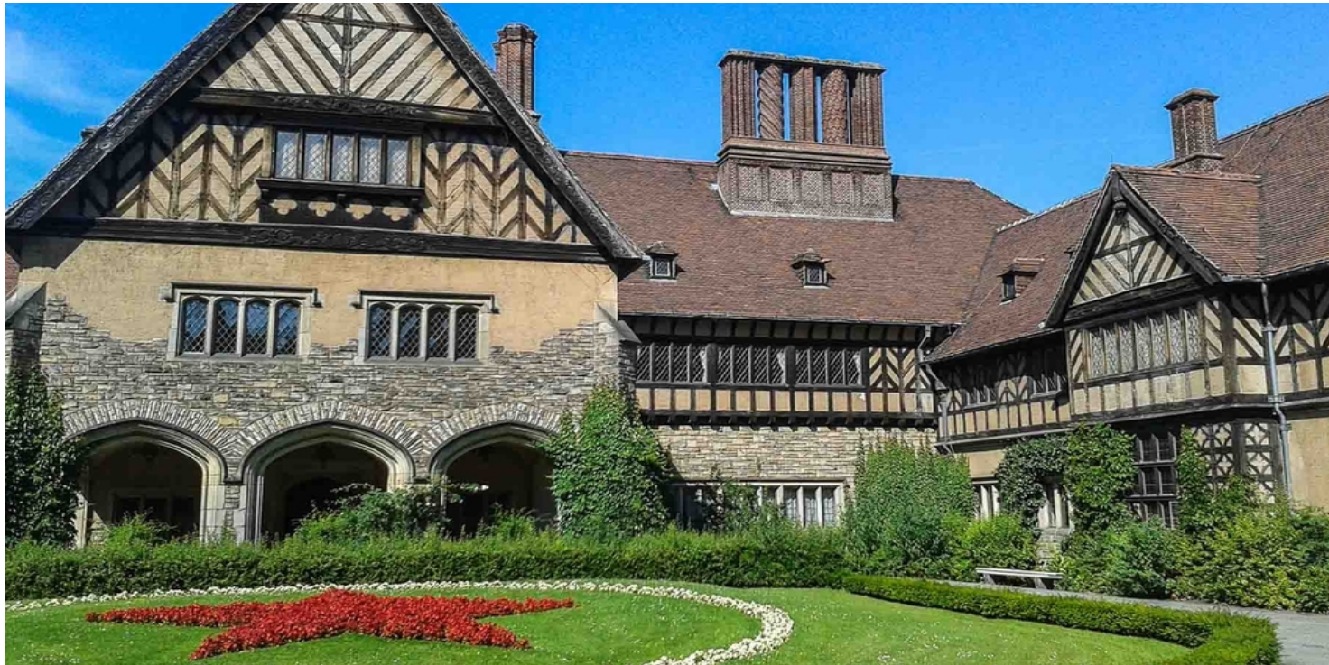
Pałac Cecilienhof w Poczdamie

https://przystanekhistoria.pl/pa2/tematy/jozef-stalin/85001,Konferencja-w-Poczdamie-Ostatnie-spotkanie-Wielkiej-Trojki.html