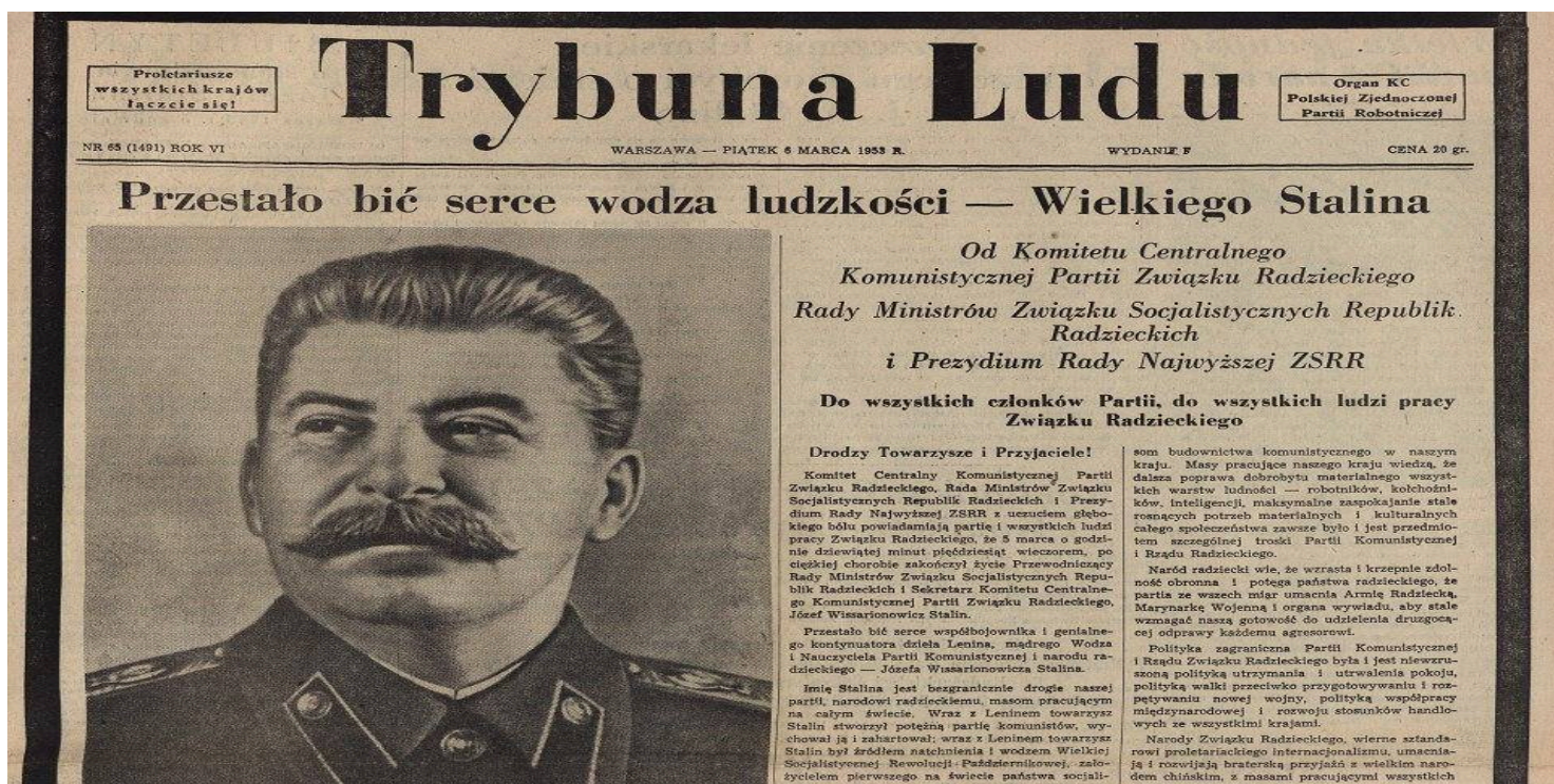
"Trybuna Ludu" informuje o śmierci Stalina

https://przystanekhistoria.pl/pa2/tematy/jozef-stalin/92425,Pogrzeb-Stalina-film-dokumentalny-Siergieja-Loznicy.html