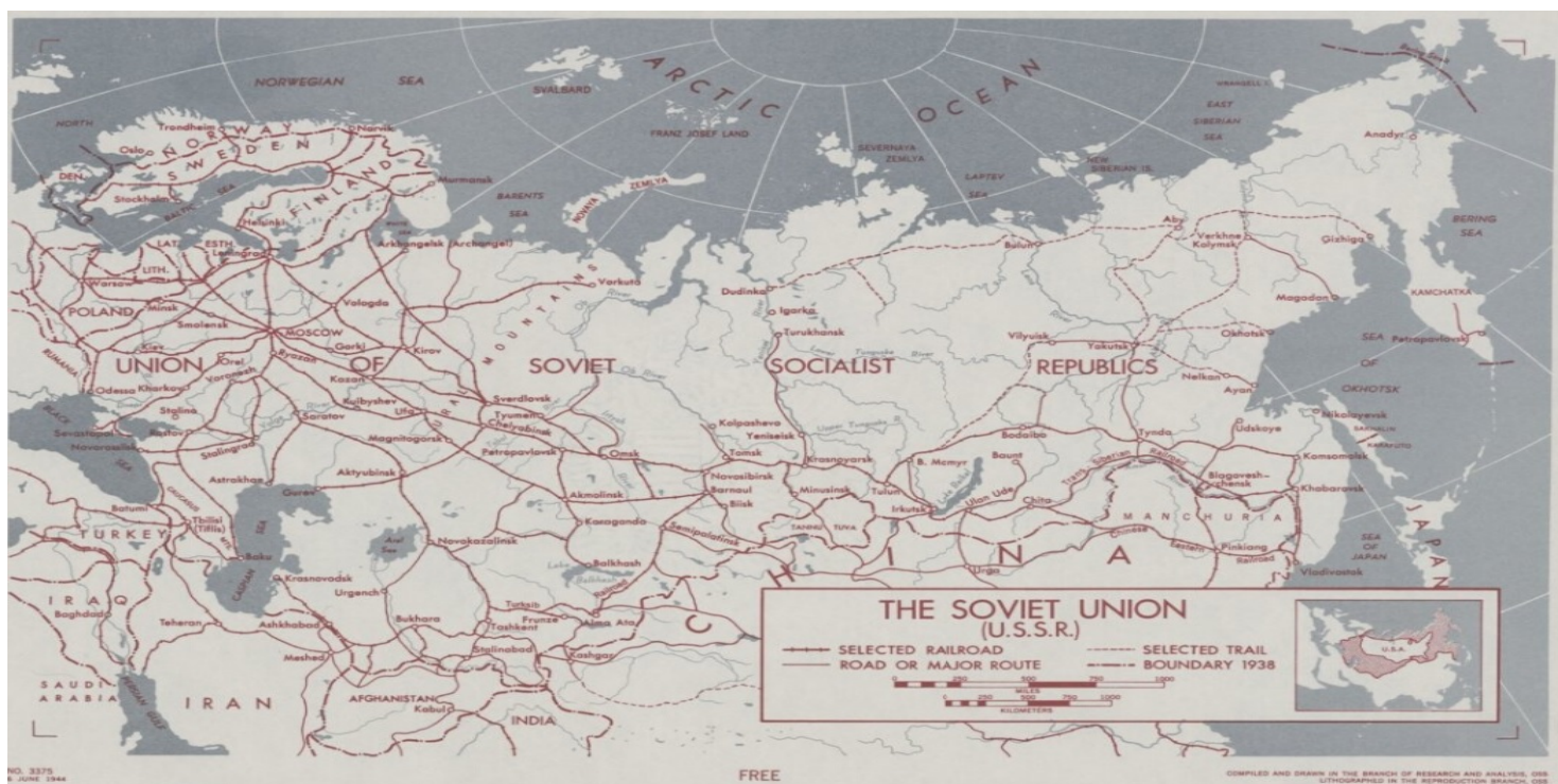
The Soviet Union (U.S.S.R.), Waszyngton 1944 (ze zbiorów Biblioteki Narodowej)

https://przystanekhistoria.pl/pa2/tematy/komunizm/106390,Polscy-biolodzy-w-czasach-lysenkizmu.html