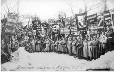
Demonstracja żołnierska przed Pałacem Taurydzkim, 1917 r.

wsparcie żołnierzy – i tylko dlatego Lenin odważył się na powstanie zbrojne. Nie mógł liczyć na większość w wyborach parlamentarnych, ale miał poparcie ludzi wyposażonych w broń. Bolszewicy dziwili się po udanej rewolucji, dlaczego opór był tak słaby i udało im się utrzymać u władzy. Oczekiwali, że wojna domowa wybuchnie już jesienią 1917 r. Przyszła jednak dużo później. Dało im to czas, by skonsolidować swoją władzę.