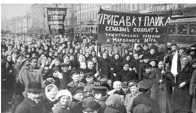
Demonstracja robotników z Zakładów Putiłowskich w Piotrogradzie, marzec 1917 r.

JB: Złożyło się na to kilka przyczyn. Po pierwsze, rozpadł się stary porządek i bardzo szybko obniżał się standard życia. Po drugie, w tym krytycznym czasie umiarkowani socjaliści – mienszewicy i eserowcy – weszli do Rządu Tymczasowego z udziałem liberałów. Popelnili tym samym wielki błąd. W oczach opinii publicznej stali się bowiem współodpowiedzialni za wszelkie niepowodzenia. Nie mogli się już powoływać na socjalizm, bo sami współrzadzili. Po trzecie, małe grupy, które są zdeterminowane i dobrze wiedzą, czego chcą, mają przewagę nad dużymi grupami, które są niezdecydowane. Bolszewicy byli pozbawieni skrupułów. Byli najbardziej radykalni spośród socjalistów i potrafili zyskać uznanie rozgoryczonych, zbiedniałych i wściekłych żołnierzy i robotników z wielkich miast, mówiąc: „Nas nie interesuje prawo. My po prostu artykułujemy waszą złość”. Liberałowie i umiarkowani socjaliści twierdzili tymczasem uparcie: „Musimy poczekać, aż będziemy mieli parlament i konstytucję. Dopiero wtedy będziemy mogli rozwiązać wielkie problemy naszych czasów: uspołecznic fabryki i rozparcelować ziemię między chłopów. Jeśli zrobimy to przed wyborami, będzie to działanie bezprawne”. Lenin mówił: „Legitymację społeczną zapewnimy sobie później. Na razie po prostu robimy, co jest do zrobienia”. Latem 1917 r. w dużych miastach Rosji było to popularne hasło.