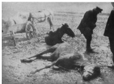
Wielki Głód na Ukrainie (okolice Charkowa, 1933 r.)