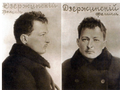
Feliks Dzierżyński, akta Ochrany,

Postanowiłem przyrzeć się porewolucyjnym losom kilkunastu znanych Polaków, którzy brali udział w rewolucji październikowej w Piotrogradzie. Lista nie jest pełna – to wyłącznie ci, o których udało mi się znaleźć informacje.