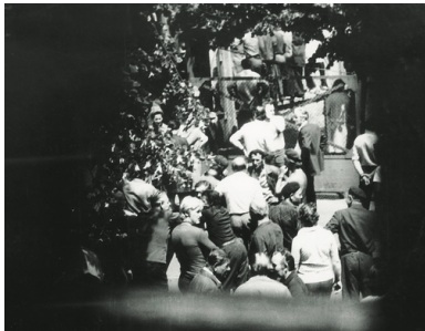
Zdjęcie uczestników protestu robotników w Radomiu wykonane przez SB z tzw. punktu zakrytego, 25 VI 1976 r.

Wypełnianie pierwszej funkcji polegało na fizycznej eliminacji osób i środowisk uznanych za zagrożenie lub potencjalne zagrożenie dla partii; drugiej – na zdobywaniu wiedzy o osobach, środowiskach i zjawiskach (trendach, procesach społecznych) traktowanych przez komunistów jako niebezpieczne bądź ważne dla funkcjonowania reżimu; trzeciej – na ochronie partii przed niepożądanymi zjawiskami i działaniami; czwartej zaś – na wywieraniu zakulisowego, niejawnego wpływu na rzeczywistość. Ostatnia funkcja była usługowa wobec represyjnej i profilaktycznej.