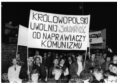
Uczestnicy Pielgrzymki Świata Pracy do Częstochowy we wrześniu 1989 r. niosą transparent o treści: Królowo Polski/ uwolnij Solidarność/ od naprawiaczy/ komunizmu .