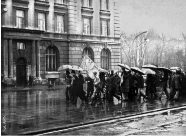
Manifestacja Konfederacji Polski Niepodległej 11 listopada 1979 r. na Placu Matejki w Krakowie.