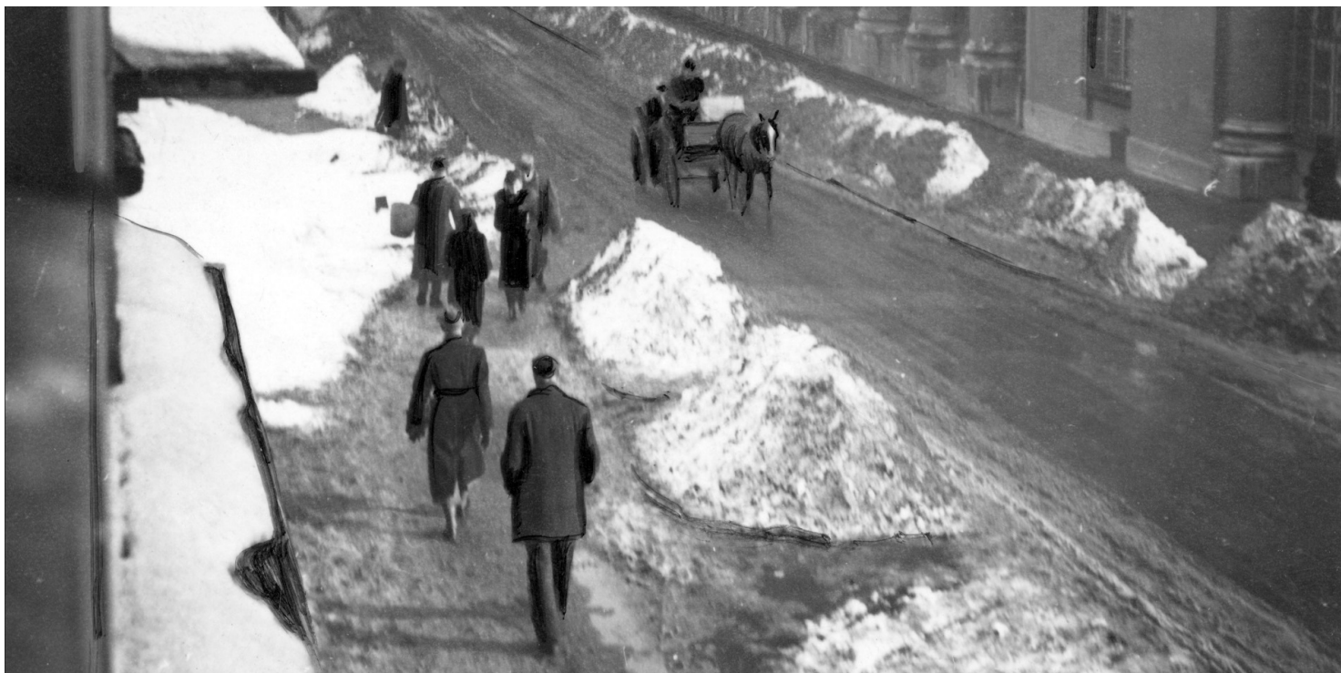
Ulica Wielopole w Krakowie, luty 1941 r.

https://przystanekhistoria.pl/pa2/tematy/konspiracja/100335,Dziwna-szkola-niezalezny-teatr.html