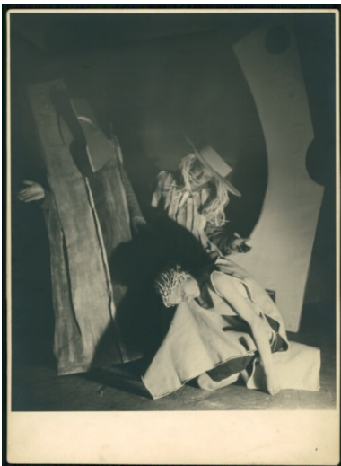
Inscenizacja Balladyny Juliusza Słowackiego w krakowskim tajnym Teatrze Niezależnym

„Już przez sam fakt wejścia do tego zamkniętego pokoju widz był zobowiązany i poniekąd zmuszony do rzetelnego współuczestnictwa i wspólnego ryzyka”.