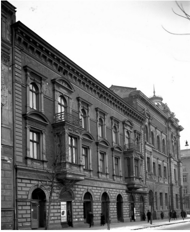
Widok zewnętrzny budynku Akademii Sztuk Pięknych w Krakowie, 1926 r.