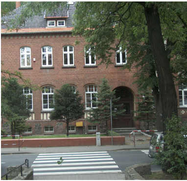
Siedziba Urzędu Bezpieczeństwa w Rawiczu

„występować w obronie wiary katolickiej oraz nawiązać kontakt z zagranicą, w szczególności Mikołajczykiem i Andersem”.