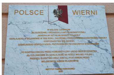
Tablica poświęcona młodzieżowej organizacji antykomunistycznej Generalny Sztab Młodzieży Polskiej w Bojanowie

Członkom organizacji Generalny Sztab Młodzieży Polskiej jesteśmy natomiast winni wdzięczną pamięć za ich szlachetne intencje i próbę podjęcia działań na rzecz wolnej Polski. W uznaniu ich zasług Instytut Pamięci Narodowej przygotował tablicę pamiątkową, która w 2020 r. została uroczyście odsłonięta na budynku Zespołu Szkół Przyrodniczo-Technicznych w Bojanowie – tego samego, do którego uczęszczali przed laty młodzi konspiratorzy.