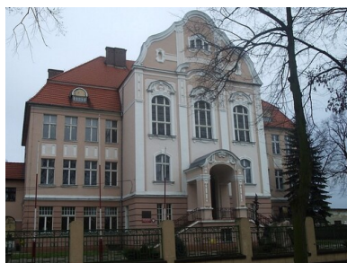
Budynek szkoły w Bojanowie

Historycy wskazują na znamienne prawidłowość, wedle której wraz z roz biciem oddziałów partyzanckich i zanikiem aktywności zbrojnego podziemia, prężnie poczęły rozwijać się różnego rodzaju organizacje młodzieżowe, grupujące uczniów, harcerzy bądź studentów. O ile w Wielkopolsce powojenna konspiracja wojskowa była stosunkowo nieliczna, to w przypadku grup młodzieżowych region ten zajmował czołowe miejsce w skali kraju.