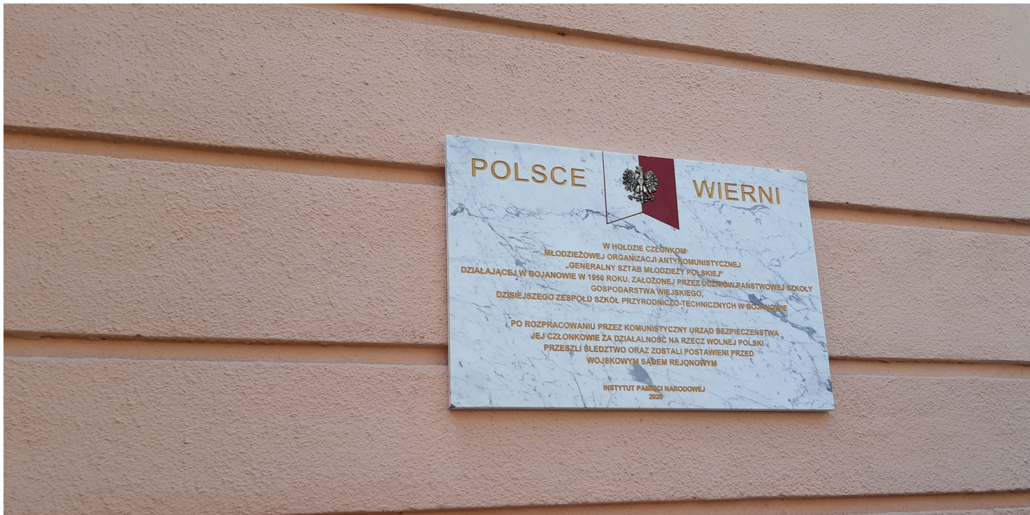
Tablica poświęcona młodzieżowej organizacji antykomunistycznej Generalny Sztab Młodzieży Polskiej w Bojanowie

https://przystanekhistoria.pl/pa2/tematy/konspiracja/101397,Generalny-Sztab-Mlodziezy-Polskiej-w-Bojanowie.html