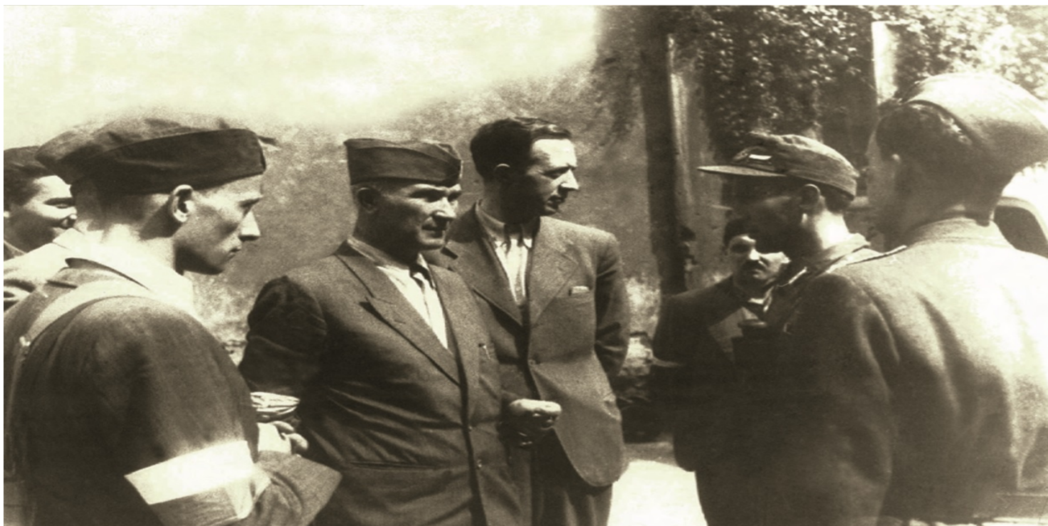
Plk Antoni Chruściel „Monter” podczas Powstania Warszawskiego, 1944 r.

https://przystanekhistoria.pl/pa2/tematy/konspiracja/32746,Monter-dowodca-Powstania-Warszawskiego.html