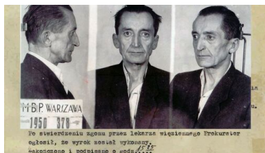
Generał „Nil” po aresztowaniu w 1950 r.

W marcu 1945 r. Okulicki i Fieldorf spotkali się w Łodzi. Następnie „Nil” wyjechał do Milanówka, gdzie odbył rozmowę z płk. Janem Mazurkiewiczem „Radosławem”. Zaraz po tym spotkaniu generał został zatrzymany przez NKWD.