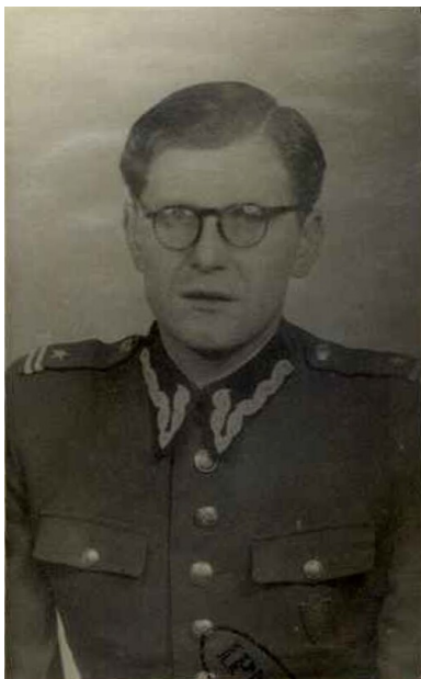
Adam Humer, wysoki funkcjonariusz śledczy MBP, kolaborant sowiecki i zbrodniarz stalinowski.