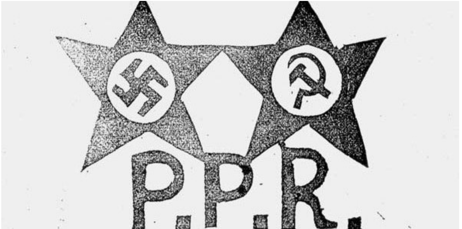
Ulotka Zrzeszenia "Wolność i Niezawisłość".

https://przystanekhistoria.pl/pa2/tematy/konspiracja/63165,Sledztwo-i-proces-I-Zarzadu-Glownego-WiN.html