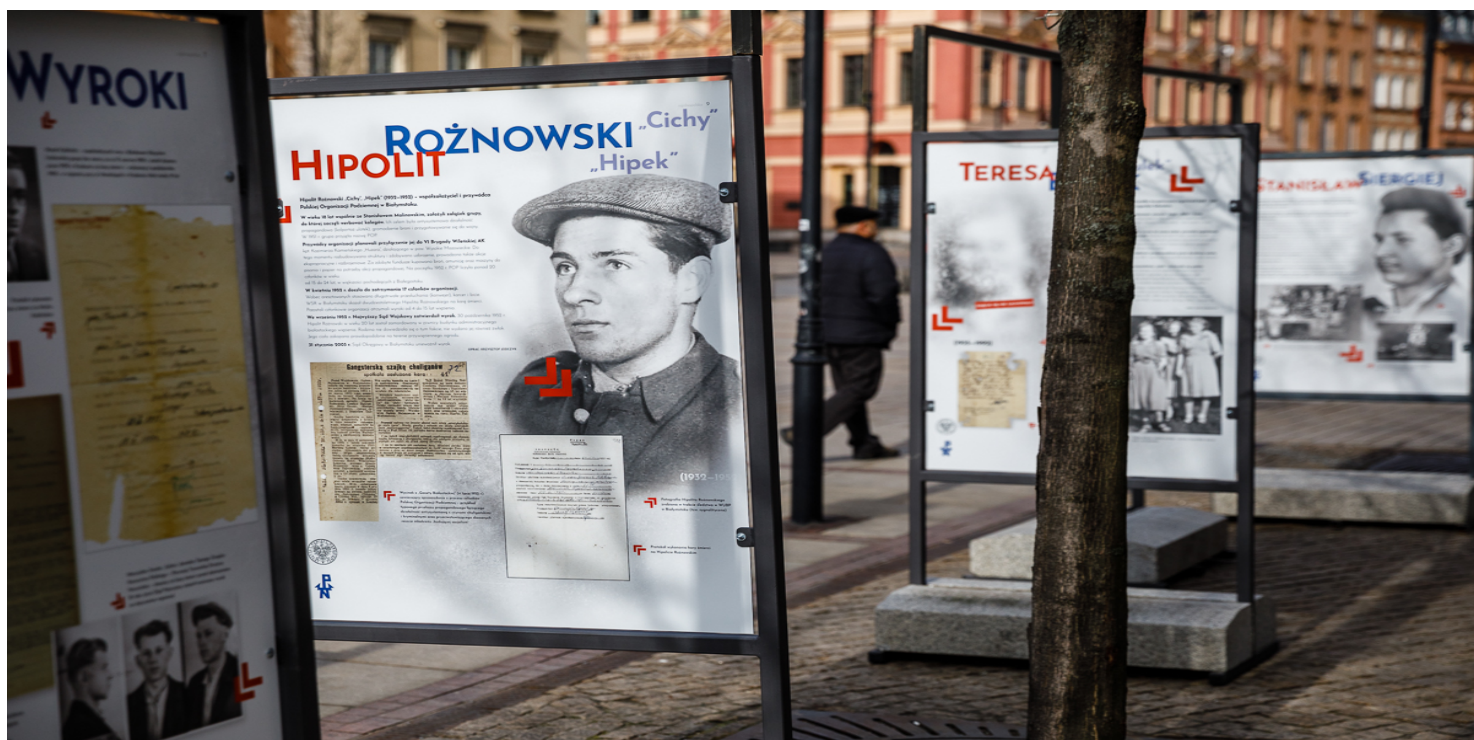
Otwarcie wystawy „Zapomniane ogniwo. Konspiracyjne organizacje młodzieżowe na ziemiach polskich w latach 1944/45–1956” – Warszawa, 1 marca 2019.

https://przystanekhistoria.pl/pa2/tematy/konspiracja/63420,Polska-mlodziez-w-realiach-powojennych.html