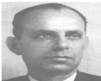
Roman Romkowski (1907-1968), właściwie: Natan Grinszpan-Kikiel