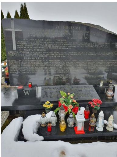
Pomnik organizacji Wolność i Niezawisłość w Suchodołach, w powiecie suwalskim.