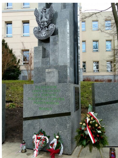
Pomnik Armii Krajowej oraz Narodowych Sił Zbrojnych w Olsztynie.

Kolportowano również przywożone z zewnątrz plakaty i ulotki, szczególnie ważne w walce w okresie referendum ludowego i przed wyborami do Sejmu Ustawodawczego. Rozsyłano je pocztą i rozwieszano na ulicach Olsztyna, Giżycka, Pisz, Kętrzyna, Olecka, Szczytna czy Ełku. Wśród nich znalazły się m.in. rysunki satyryczne, a także materiały zatytułowane WiN czuwa , Kochani Rodacy Rolnicy , Kim jest PPR? .