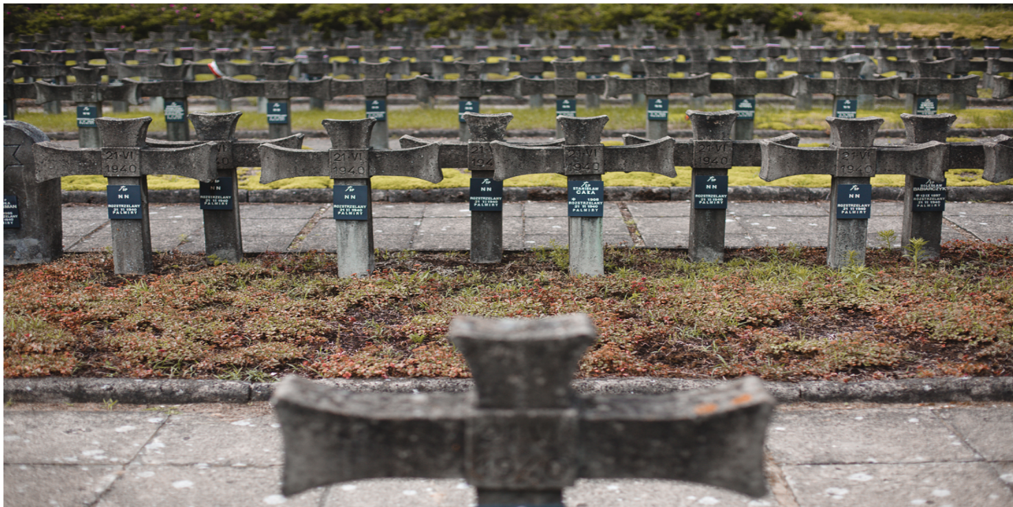
Utworzony po wojnie cmentarz w Palmirach – miejsce pamięci pomordowanych – 2020 r.

https://przystanekhistoria.pl/pa2/tematy/konspiracja/93029,Witold-Hulewicz-poeta-radiowiec-i-konspirator.htm