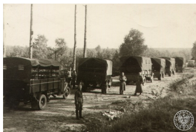
Kolumna samochodów z transportem więźniów na miejsce straceń w Palmirach, 1939-1941 r.