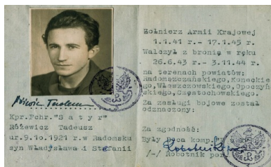
Akowska legitymacja Tadeusza Różewicza.