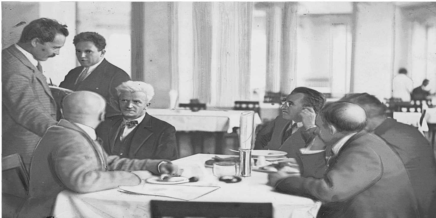
Dyskusja parlamentarzystów PPS w bufecie sejmowym. Widoczny poseł Zygmunt Zaremba (pierwszy z lewej), senator Andrzej Strug (siedzi drugi z lewej) oraz Adam Próchnik (stoi między Zarembą a Strugiem), 1929 r.

https://przystanekhistoria.pl/pa2/tematy/konspiracja/94327,Konspirator-legionista-pisarz-Andrzej-Strug-18711937.html