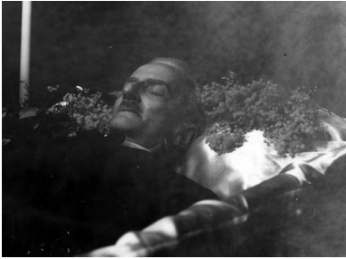
Andrzej Strug na łożu śmierci,

przekonuje masy polskiego społeczeństwa do racji niepodległościowych na początku wojny wcale nieoczywistych; nakłania je do płacenia ceny – bo zwycięstwa nie uzyska się za darmo.