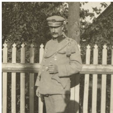
Andrzej Strug jako żołnierz Legionów Polskich, 1915 r.

W Archangielsku znalazł się w połowie 1897 r. Przyszły pisarz Andrzej Strug należał więc, podobnie jak Józef Piłsudski, do ostatniego pokolenia rodaków zsyłanych od ponad stu lat w głąb imperium – pokolenia zamykającego długi łańcuch carskich katorżników. Znalazł się w bardziej cywilizowanych warunkach niż więźniowie od czasów Konfederacji Barskiej i Powstania Kościuszkowskiego, mógł więc przemyśleć swą postawę, dokonać wyborów, przygotować się do dalszej drogi życiowej.