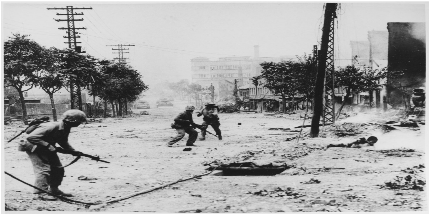
Amerykańscy marines w czasie walk miejskich w Seulu, 1950 r. (domena publiczna)

https://przystanekhistoria.pl/pa2/tematy/konspiracja/94433,Ku-rewolucji-i-wojnie-Korea-Polnocna.html