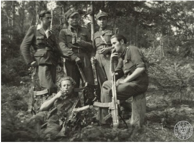
Partyzanci z oddziału NSZ „Żandarmeria” w 1946 r.