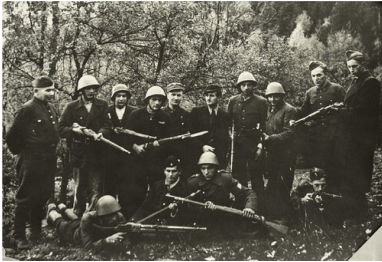
Oddział Partyzancki AK „Chełm” w Sidzinie jesienią 1944 r.