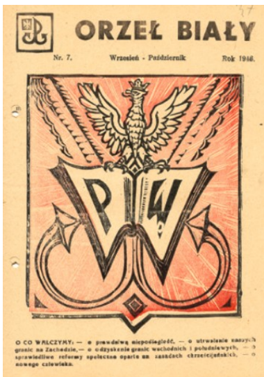
Winieta podziemnego miesięcznika „Orzeł Biały” wydawanego w Obszarze Południowym WiN.