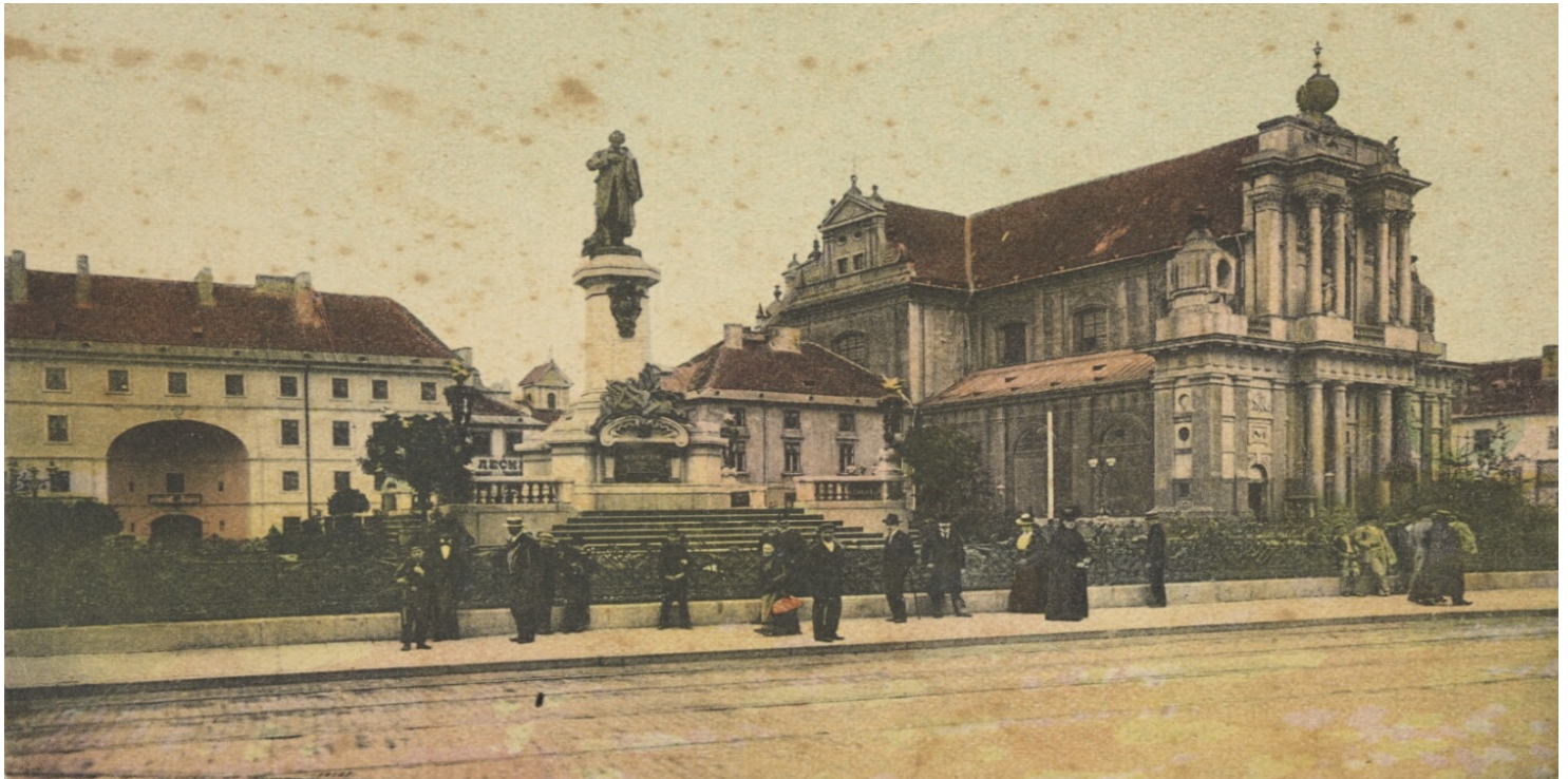
Pomnik Adama Mickiewicza przy Krakowskim Przedmieściu w Warszawie, pocztówka z początku XX w. ze zbiorów Biblioteki Narodowej

https://przystanekhistoria.pl/pa2/tematy/konspiracja/96351,Droga-do-niepodleglej-Polski-Niepokorni.html