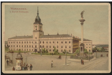
Zamek Królewski w Warszawie na pocztówce z lat 1898-1906, ze zbiorów Biblioteki Narodowej

Upadek powstania styczniowego w 1864 r. oraz klęska Francji (uznawanej przez Polaków ze znaczną przesadą za sprzymierzeńca) w wojnie z Prusami w 1871 r. sprawiły, że sprawa polska przestała być problemem polityki międzynarodowej. Wydarzenia te usunęły w cień zwolenników powstańczej walki o niepodległość. W działaniach Polaków zaczęła dominować praca organiczna, której celem był wszechstronny rozwój gospodarczy i likwidacja zacofania cywilizacyjnego ziem polskich. Jej uczestnicy byli zdecydowani trwać przy polskości oraz obronić i rozszerzać stan posiadania w sferze gospodarki i kultury, ale rezygnowali z walki o suwerenność. Następne pokolenie odrzuciło jednak apolityczne hasło pracy organicznej. W latach dziewięćdziesiątych XIX w. na ziemiach polskich zaczęły kształtować się nowoczesne ruchy ideowe, które z czasem stały się fundamentem polskiego życia politycznego: ruch socjalistyczny, narodowy, powstały nieco później w Galicji ruch ludowy oraz chrześcijańsko-demokratyczny na Śląsku. Działacze tych środowisk wywodzili się z młodej inteligencji polskiej nazwanej pokoleniem „niepokornych” – ponieważ nie zgadzali się na bierność wobec niewoli.