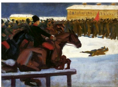
Demonstracja uliczna w 1905. Obraz Władysława Skoczylasa ze zbiorów Muzeum Narodowego w Warszawie

W czasie rewolucji 1905 r. do rozłamu doszło również w PPS. Działacze związani z Piłsudskim – tzw. starzy, dla których priorytetem była walka o niepodległą Polskę, utworzyli PPS-Frakcję Rewolucyjną. Natomiast zwolennicy współpracy z socjaldemokracją rosyjską, którzy przeciwstawiali się w ogóle istnieniu odrębnego państwa polskiego – tzw. młodzi, stworzyli PPS-Lewicę i odtąd ściśle współdziałali w zwalczaniu idei niepodległościowej z inną skrajną partią lewicową – Socjaldemokracją Królestwa Polskiego i Litwy. Po rozłamie w PPS Piłsudski i jego zwolennicy przenieśli swoją działalność do zaboru austriackiego. W następnych latach stali się głównymi rzecznikami stworzenia siły zbrojnej, która w odpowiednim momencie miała przystąpić do walki z Rosją o niepodległość Polski.