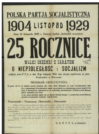
Afisz dot. obchodu 25. rocznicy manifestacji na placu Grzybowskiem w Warszawie z 1904 r., ze zbiorów Biblioteki Narodowej

Na rozwój świadomości narodowej we wszystkich zaborach wpłynęła jednak nie tylko działalność polityczna. Ważną rolę odegrała twórczość Henryka Sienkiewicza, piszącego „ku pokrzepieniu serc” o wielkości dawnej Rzeczypospolitej, którego chłopcy witali słowami „Tyś nas zrobił Polakami”, malarstwo Jana Matejki, a w wypadku inteligencji – budzące dumę z przeszłości Polski prace historyczne Szymona Askenazego. Nieocenione zasługi w uświadomieniu narodowym chłopów mieli polski nauczyciel i ksiądz.