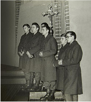
Alumni-żołnierze 56. Szkolnego Batalionu Ratownictwa Terenowego w Brzegu podczas Mszy św.