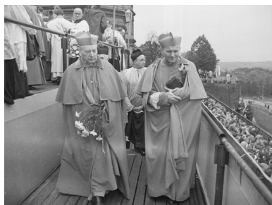
Prymas Stefan Wyszyński i Arcybiskup Karol Wojtyła na wałach klasztoru na Jasnej Górze w czasie uroczystości milenijnych

zasobach Archiwum IPN w Poznaniu licząca 128 kart teczka o sygnaturze 0639/72. Jednym z najważniejszych dokumentów w niej zawartych jest kwestionariusz osobowy Arcybiskupa, w którym obok zdjęcia legitymacyjnego, znalazł się cały szereg informacji dotyczących Antoniego Baraniaka.