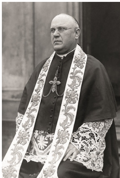
Abp Aleksander Kakowski.

Kolejnym krokiem abpa Kakowskiego było dążenie do zapewnienia ziemiom polskim przedstawiciela Stolicy Apostolskiej niezależnego od dotychczasowych zaborców. Te zabiegi przyniosły efekt wiosną 1918 r., kiedy do Warszawy przybył jako delegat Watykanu ks. Achille Ratti, późniejszy papież Pius XI. Jak się okazało, Polska zyskała nie tylko oficjalną sankcję w świecie dyplomacji międzynarodowej, lecz także oddanego przyjaciela, który odegrał ważną rolę w czasie wojny polsko-bolszewickiej.