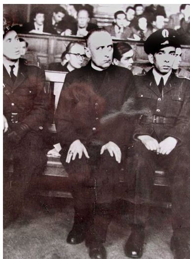
Podczas procesu w 1949 r.

W stolicy prymas starał się porządkować sprawy kościelne. Rząd Imre Nagya zobowiązał się naprawić krzywdy wyrządzone Kościołowi w czasach terroru Rákosiego. Przywrócona miała zostać suwerenność władzy biskupów, zwalniano z więzień księży, wkrótce miano przeprowadzić ich rehabilitację. Wieczorem 3 listopada prymas wygłosił radiowe orędzie do narodu. Wzywał do zaniechania samosądów i terroru wobec przeciwników politycznych. Rządowi Imre Nagya udzielał warunkowego wsparcia. Domagał się przywrócenia wolności Kościołowi. Wyraził również oczekiwanie, że z Węgier zostaną wycofane wojska sowieckie i przeprowadzone zostaną wolne wybory pod międzynarodową kontrolą. Po nagraniu wrócił do rezydencji w Budzie, ale w nocy został wezwany do parlamentu. Przebywali tam już członkowie rządu. Napięcie było ogromne, lada chwila spodziewano się szturm sowieckich czołgów. Kiedy atak się zaczął, minister Zoltán Tildy poradził prymasowi, aby szukał ratunku na własną rękę, gdyż wszystko jest stracone. O świcie Mindszenty schronił się w amerykańskiej ambasadzie przy pl. Wolności. 8