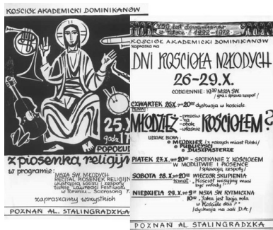
Plakaty Duszpasterstwa Akademickiego.