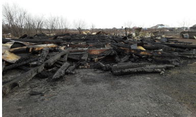
Kościół św. Antoniego z Padwy, spalony 19 kwietnia 2017 r.

Po pierwszym wstrząsie wierni znów ruszyli do pracy, ogłosili zbiórkę finansów, także w Polsce, na odbudowę. Bo mieszkańców syberyjskiego Białegostoku złamać niepodobna. [Kościół został odbudowany w roku 2019 - red. ]