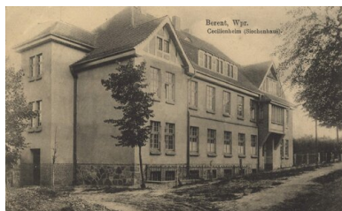
Zdjęcie wykonane w Kościerzynie przed 1914 rokiem

Polityka wojny kulturowej realizowana przez kanclerza i głównego autora zjednoczenia Niemiec w 1871 r. Ottona von Bismarcka, pojmowana w szerokim znaczeniu, wymierzona była w Kościół rzymskokatolicki w całym państwie, jako że był on jednym z nielicznych segmentów gmachu nowego Cesarstwa Niemieckiego nie wkomponowujących się w kreowane w Berlinie wizje polityczne. Szczególny przebieg konfrontacja ta przybrała na ziemiach zamieszkiwanych przez ludność polską, gdzie aspekt wyznaniowy wzmagał podział przebiegający już i tak wyraźnie w wielu innych obszarach.