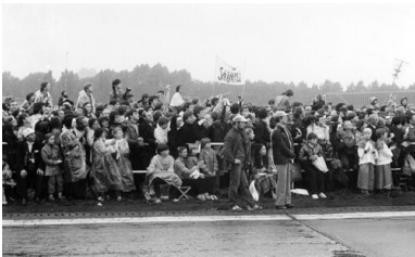
Wierni witający papieża Jana Pawła II przed mszą. Zdjęcie ze spotkania z papieżem w Katowicach-Muchowcu, 20 VI 1983 r.