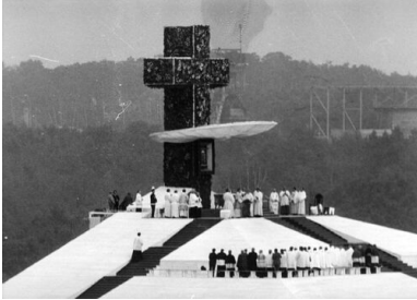
Ołtarz przygotowany na mszę papieską w Katowicach-Muchowcu, 20 VI 1983 r.

opozycjoniści z nadziejami, a rządzący z obawami. Szczegółowo je analizowano i doszukiwano się w nich dodatkowych podtekstów. A o to nie było trudno. Nic zatem dziwnego, że część, a nawet wiele, wypowiedzi papieskich nie spodobało się peerelowskim władzom.