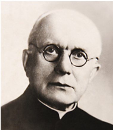
Ks. Michał Sopoćko