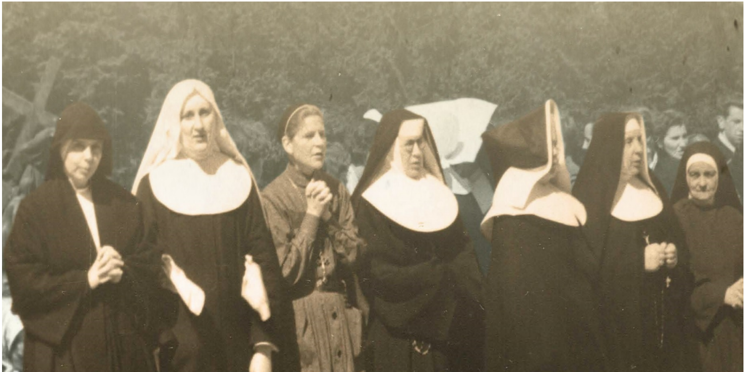
Fot. z wystawy IPN „Trudne lata – wielkie dni. Zakony żeńskie w PRL”

https://przystanekhistoria.pl/pa2/tematy/kosciol/68427,Zakonnice-na-wygnaniu.html