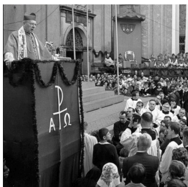
Prymas Wyszyński wygłasza kazanie podczas uroczystej mszy św. pontyfikalnej przed Bazyliką Św. Jadwigi Śląskiej w Trzebnicy - 16 X 1966 r.

Prymas, wówczas już bardzo schorowany, radził Gierkowi, aby natychmiast wsiadł do samolotu i poleciał do stoczni w Gdańsku, bo w takim momencie to jest obowiązek przywódcy państwa. Gierek był roztrzęsiony, niemal płakał i prosił o pomoc. Tak wyglądała władza: z jednej strony totalitarna, a z drugiej – totalnie bezsilna. Po tej rozmowie prymas zrozumiał, że „po stronie komunistycznej” nikt nie panuje nad państwem; jak również to, że konflikt ze społeczeństwem może zostać rozwiązany siłowo, bo władza ma totalitarne zapędy, a przywódcy państwa nie są w stanie podjąć żadnych racjonalnych decyzji.