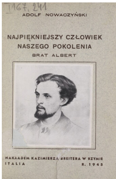
Adolf Nowaczyński Najpiękniejszy człowiek naszego pokolenia Brat