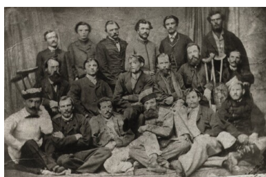
Adam Chmielowski (stoi w górnym rzędzie drugi od prawej) wśród powstańców.