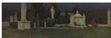
Adam Chmielowski Szara godzina, Lwów, 1880.