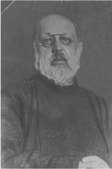
Brat Albert (Adam Chmielowski) - założyciel Zgromadzenia Braci Albertynów Trzeciego Zakonu Świętego Franciszka Posługujących Ubogim. 1900 - 1916.