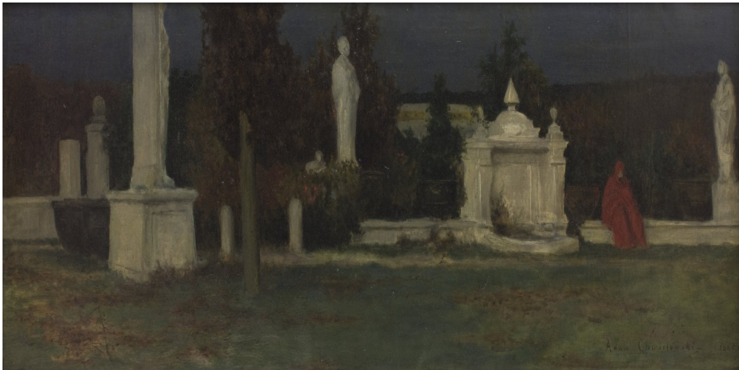
Adam Chmielowski Szara godzina , Lwów, 1880. Ze zbiorów Muzeum Narodowego w Krakowie

https://przystanekhistoria.pl/pa2/tematy/kosciol/69471,Swiety-Brat-Albert-Powstaniec-artysta-zakonnik-opiekun-ubogich.html