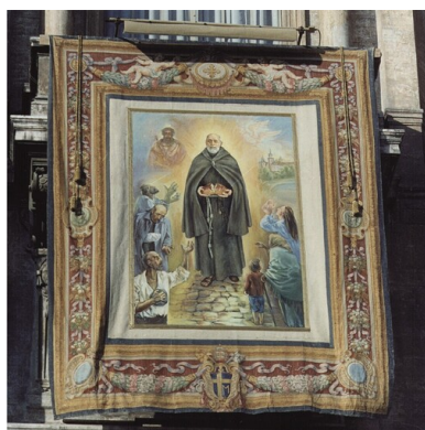
Obraz kanonizacyjny namalowany przez s. Lidię Pawełczak, Watykan, 1989 r.

Brat Albert nie myślał początkowo o zakładaniu zgromadzeń, pragnął jedynie zdobyć pomocników do posługi najbiedniejszym. Gdy jednak przybywało braci i siostr, otwierał nowe formy pracy i nowe przytuliska w innych miastach Galicji. Podstawą działalności zgromadzeń była reguła św. Franciszka i św. Klary. Brat Albert nie pozostawił siostrom żadnej spisanej reguły, dał im swój przykład i swego ducha, aby go naśladowały w posłudze ubogim.