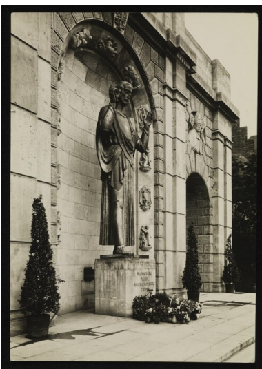
Figura Chrystusa Króla w