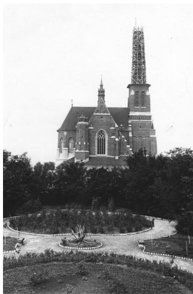
Polska, woj. wołyńskie, Kowel. Kościół Pomnik Krwi i Chwały św. Stanisława Biskupa Męczennika (przełom lat 20. i 30. XX w.; podczas budowy).

Przełożeni skierowali go na probostwo w Grodzisku Mazowieckim, a następnie w Nowym Dworze koło Warszawy. Wreszcie w maju 1930 r. przeniesiono go na Wołyń. Wykładał w Seminarium Duchownym w Łucku, a w 1931 r. został proboszczem w Kowlu. Wówczas właśnie powstała praca Przyczynek do historii męczeństwa Kościoła rzymsko-katolickiego w diecezjach kamienieckiej i łucko-żytomirskiej (1863-1930) . Dzięki jego staraniom dokończono w Kowlu budowę świątyni Pomnik Krwi i Chwały św. Stanisława Biskupa Męczennika. Dziś kościół ten już nie istnieje, bo został rozebrany po II wojnie światowej.