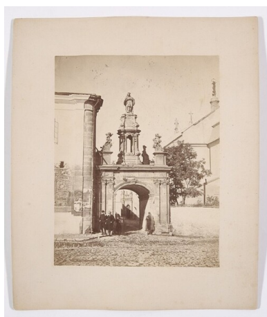
Brama katedralna w Kamieńcu