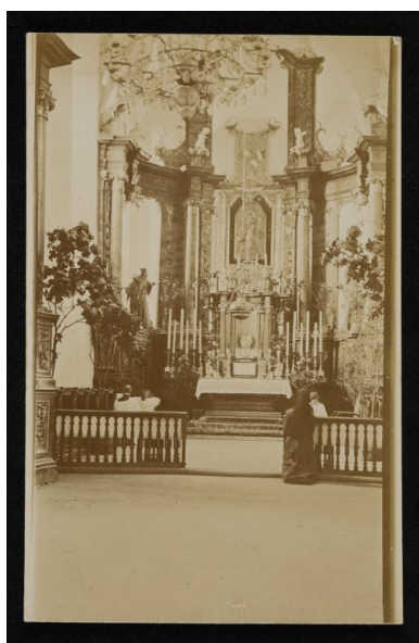
Główny ołtarz w klasztorze oo. Bernardynów w Zaslaviu, 1916. Pocztówka ze zbiorów cyfrowych Biblioteki Narodowej ( polona.pl )

„Na wypoczynek jeszcze czas będzie. Zresztą w niebie wypoczywać będziecie po trudach.” 8