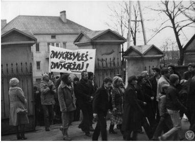
Msza święta za duszę zamordowanego ks. Jerzego Popiełuszki, Suchowola, 11 listopada 1984. Wierni wchodzący do kościoła.