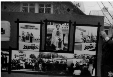
Suchowola, 11 listopada 1984. Tablica pamiątkowa ku czci zamordowanego ks. Jerzego Popiełuszki, przygotowana w związku z odprawianą tego dnia Mszą świętą za duszę męczennika.