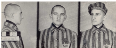
Zdjęcie Franciszka Blachnickiego z KL Auschwitz

W pracy duszpasterskiej wprowadzał nowatorskie pomysły, mające na celu odnowę moralną społeczeństwa i żywą wiarę. Zainicjował ruch trzeźwościowy pod nazwą Krucjata Wstrzeźliwości, angażował się na rzecz posoborowej odnowy liturgii w Polsce. Wykładał na Katolickim Uniwersytecie Lubelskim. Niewątpliwie dziełem jego życia był „Ruch Światło-Życie”, tzw. ruch oazowy, alternatywa dla laickiego wychowania młodzieży.