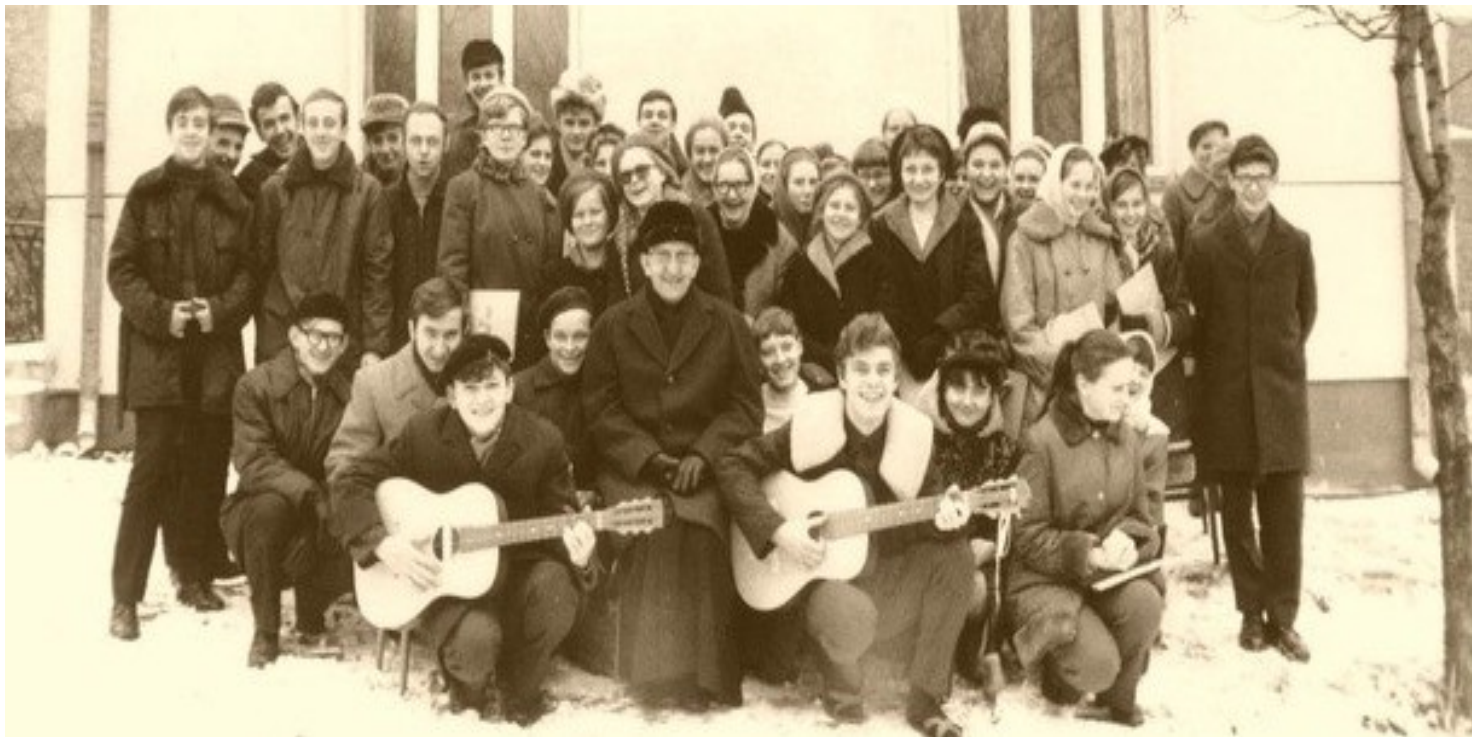
Rekolekcje dla animatorów w Lublinie w 1972 r.

https://przystanekhistoria.pl/pa2/tematy/kosciol/79606,Przewodnik-w-czasach-zniewolenia-ks-Franciszek-Blachnicki.html