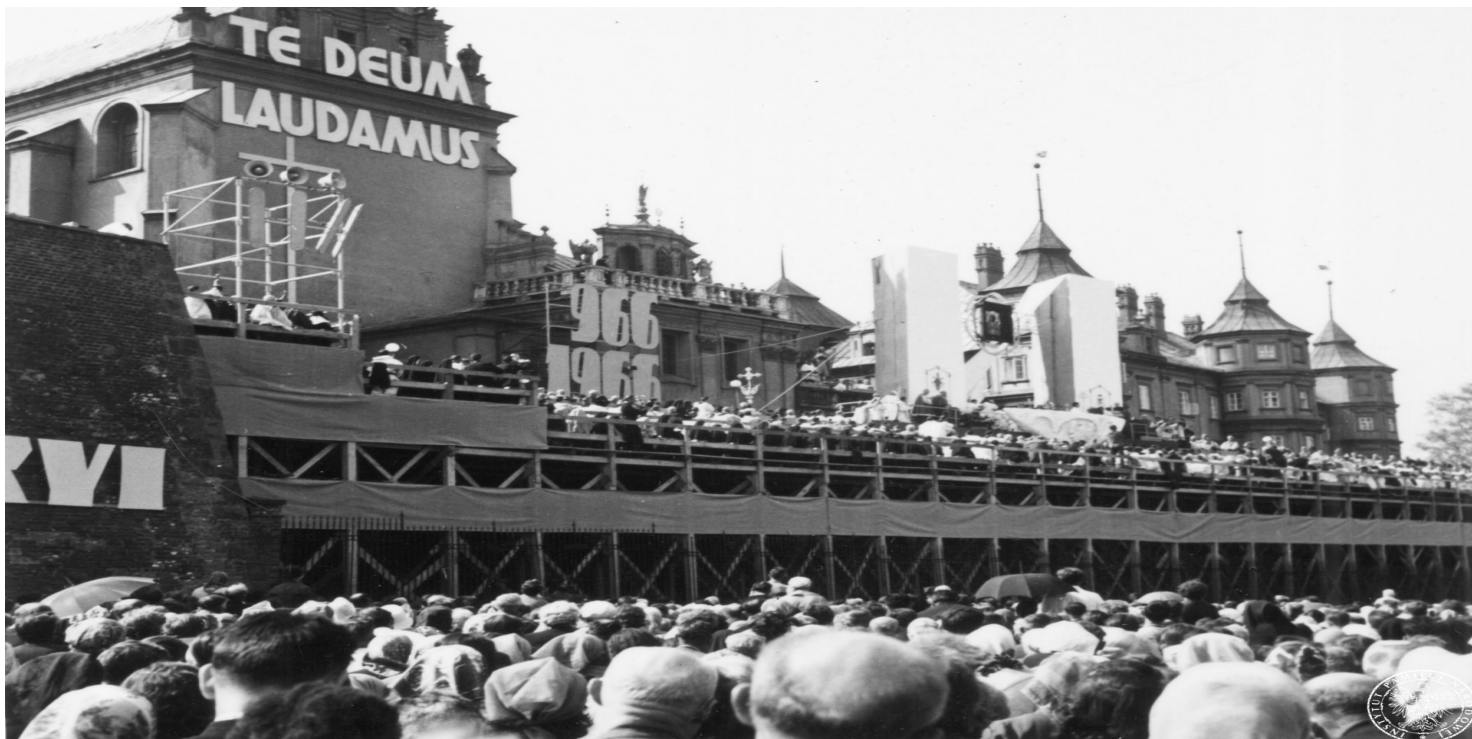
Obchody Milenium Chrztu Polski w Częstochowie. Tłumy wiernych na błoniach klasztoru oo. Paulinów na Jasnej Górze. Widok z wieży.

https://przystanekhistoria.pl/pa2/tematy/kosciol/81607,Millenium-Chrztu-Polski.html