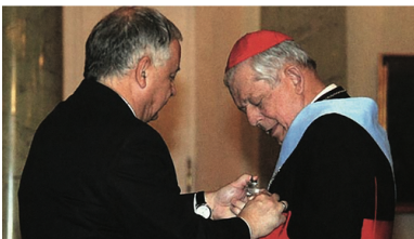
Prezydent Lech Kaczyński dekoruje kard. Józefa Glempa Orderem Orła Białego, 2009 r.

Te słowa prymas Glemp traktował jak motto swego nauczania i przesłanie dla kolejnych pokoleń Polaków.