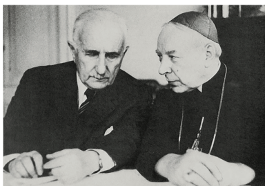
Kard. Stefan Wyszyński z prof. Władysławem Tatarkiewiczem

Tak bliska współpraca ks. Glempa z Prymasem Tysiąclecia zakończyła się w marcu 1979 r., kiedy to ten pierwszy został ordynariuszem diecezji warmińskiej. Sakrę biskupią otrzymał z rąk kard. Wyszyńskiego. Prymas już wcześniej starał się o biskupstwo dla swego sekretarza, najpierw w 1975 r., kiedy był on kandydatem na arcybiskupa wrocławskiego, a następnie w 1977 r. – z myślą o arcybiskupstwie poznańskim. Władze państwowe dwa razy odrzuciły jednak tę kandydaturę. Najprawdopodobniej obawiały się nadmiernego wpływu kard. Wyszyńskiego, wiedząc, że ks. Glemp ma bliski dostęp do niego oraz do ważnych dokumentów i w ten sposób może wywierać wpływ na działalność całego duchowieństwa w Polsce. Z perspektywy władz państwowych był to więc kandydat niebezpieczny.