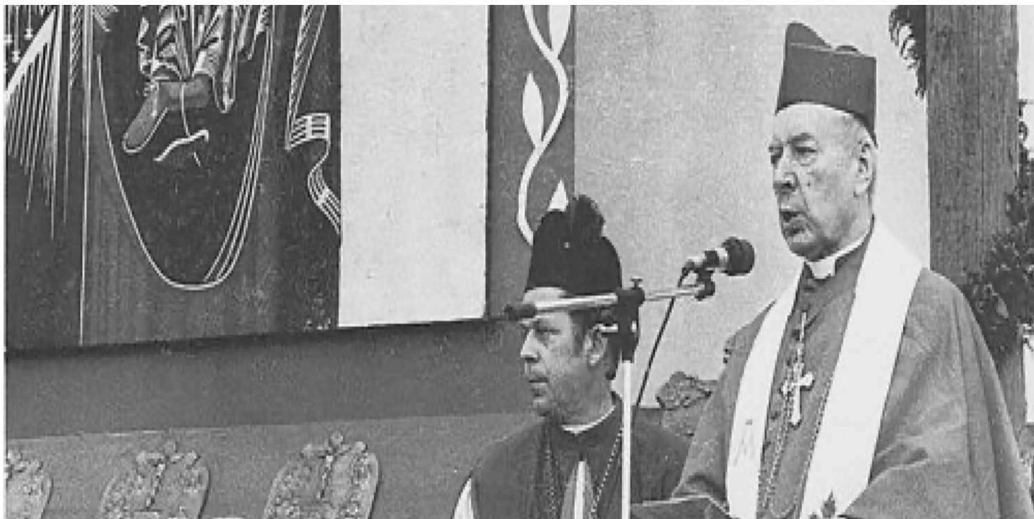
Słupsk, 26 czerwca 1977 r. – piąta rocznica kanonicznego uregulowania organizacji kościelnej na Ziemiach Odzyskanych; obok Prymasa Stefana Wyszyńskiego ks. prał. Józef Glemp.

https://przystanekhistoria.pl/pa2/tematy/kosciol/86053,Prymas-Tysiaclecia-w-oczach-jego-nastepcy.html