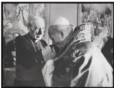
Braterski i ojcowski pocałunek. Kardynał Stefan Wyszyński podczas prywatnej audiencji u Jana Pawła II, 1978.

Zasługuje na szczególne podkreślenie, że z tak wielkim szacunkiem i uwielbieniem Prymas Wyszyński mówił o człowieku od siebie o prawie dwadzieścia lat młodszym, który wcześniej przez kilkanaście lat był jego współpracownikiem w Episkopacie Polski.