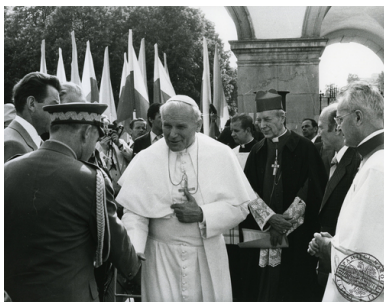
Powitanie Jana Pawła II przy grobie Nieznanego Żołnierza, 2 VI 1979 r.

Wydaje się więc, że podejście do polityki obu hierarchów nie było tak odmienne, jak sugeruje Weigel – łączyło bowiem elementy twardej świadomości realiów politycznych z moralnym obowiązkiem obrony wolności religijnej.