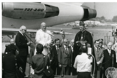
Powitanie Papieża Jana Pawła II na lotnisku w Warszawie, 2 czerwca 1979 r. Po lewej stronie Papieża stoi kard. Stefan Wyszyński.

Polski, jak i Rady Głównej Episkopatu, a także część zapisów dźwiękowych tych konferencji. Pozwala nam to z całą pewnością powiedzieć, że kard. Wyszyński, choć był uznawany za bezdyskusyjnego lidera polskiego episkopatu, nie narzucał swego zdania pozostałym polskim hierarchom w sposób apodyktyczny, nie wtrącał się też w zasadzie w wewnętrzne sprawy poszczególnych diecezji. W związku z tym szanował opinię i sferę samodzielności poszczególnych członków kierowanego przez siebie episkopatu.