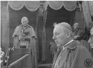
Msza w pierwszą rocznicę uroczystości millenijnych na Jasnej Górze w Częstochowie. Prymas Stefan Wyszyński za ołtarzem, w tle na podwyższeniu Arcybiskup Karol Wojtyła, 3 maja 1973 r. Fot. AIPN

„mimo różnic między nimi, wyrażają poglądy i wizje katolicyzmu różnego od zachodniego, [...] o wyraźnym ludowym charakterze” 4 .