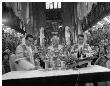
Msza św. (pod przewodnictwem prymasa Wyszyńskiego) dla młodzieży we wrocławskiej Archikatedrze Św. Jana Chrzciciela - 16 października 1966 r.

Także uważna lektura protokołów obrad Konferencji Episkopatu Polski i Rady Głównej Episkopatu nie uprawnia do tego rodzaju wniosków. Prymas – zresztą wraz z całym polskim episkopatem (dodajmy: w tym abp. Wojtyła) – uczestniczył w procesie wprowadzania w życie reform soborowych z całą lojalnością i trudno jest odnaleźć ślady opóźniania przezeń ich wprowadzenia.