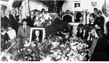
Wystawienie trumny po śmierci prymasa Stefana Wyszyńskiego w Warszawie, 31 maja 1981 r.