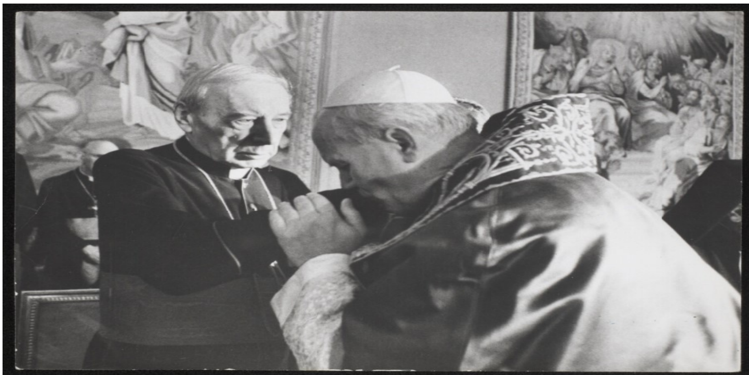
Braterski i ojcowski pocałunek. Kardynał Stefan Wyszyński podczas prywatnej audiencji u Jana Pawła II, 1978.

https://przystanekhistoria.pl/pa2/tematy/kosciol/86134,Jan-Pawel-II-i-Prymas-Wyszynski.html