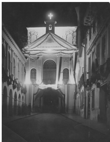
Ostra Brama z cudownym obrazem Matki Boskiej Ostrobramskiej.