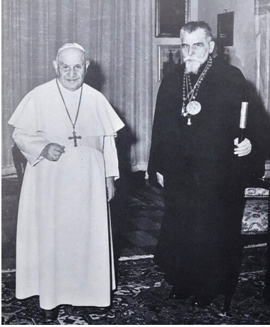
Papież Jan XXIII i bp Josyf Slipy.