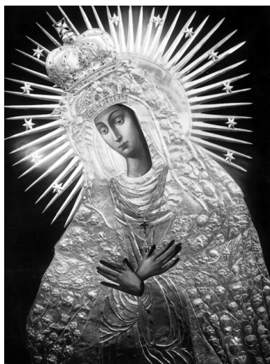
Cudowny obraz Matki Boskiej Ostrobramskiej. Zdjęcie z lat 20. XX w. - okresu przynależności Wilna do Polski.

Nikt chyba tak jak on nie cierpiał z powodu prześladowań chrześcijan w krajach obozu sowieckiego. Jeszcze do dziś porażają jego słowa świadczące o tym, jakim bólem przepełniał go los tamtejszych wyznawców Chrystusa. W wyjątkowo niesprzyjających okolicznościach robił, co mógł, podejmując wielkie ryzyko, aby im pomóc i aby mieli świadomość, że nie zostali osamotnieni.