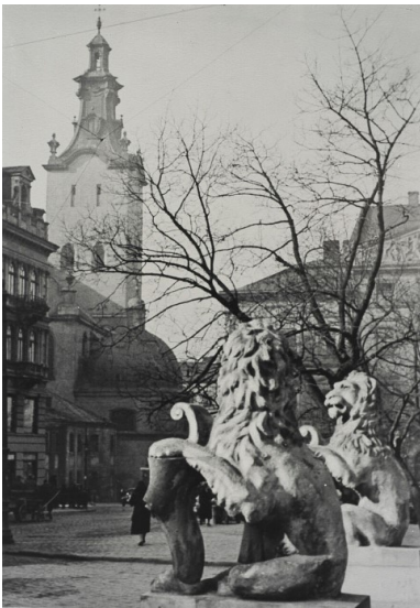
Lwów, widok z Rynku na katedrę łacińską Wniebowzięcia

Wyrazem współodpowiedzialności za Kościoły w krajach diamentu była jego rozmowa z Pawłem VI – 10 listopada 1968 r. – kiedy mówił o swoim obowiązku udzielania święceń i sakramentów tym katolikom, którzy nie mają dostępu do swoich pasterzy. Tak też czynił jeszcze za pontyfikatu Jana XXIII.