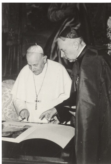
Prymas Polski ks. kardynał Stefan Wyszyński podczas audiencji u papieża Jana XXIII (1958 - 1963).