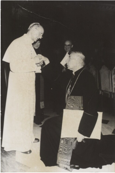
Prymas Polski ks. kardynał Stefan Wyszyński podczas audiencji u papieża Pawła VI, 1977.