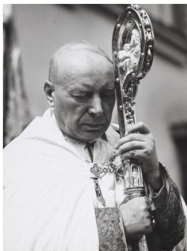
Prymas Polski ks. kardynał Stefan Wyszyński.