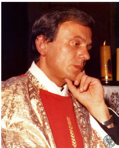
Jerzy Popiełuszko, polski ksiądz, męczennik, błogosławiony Kościoła.

Tekst pochodzi z numeru 10/2019 „Biuletynu IPN”