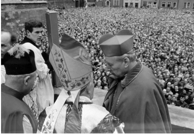
Ks. kard. Stefan Wyszyński w rozmowie z biskupem Michałem Klepaczem (w mitrze, tyłem) przed końcowym błogosławieństwem w trakcie obchodów Tysiąclecia Chrztu Polski w Gdańsku, 29 maja 1966 r.