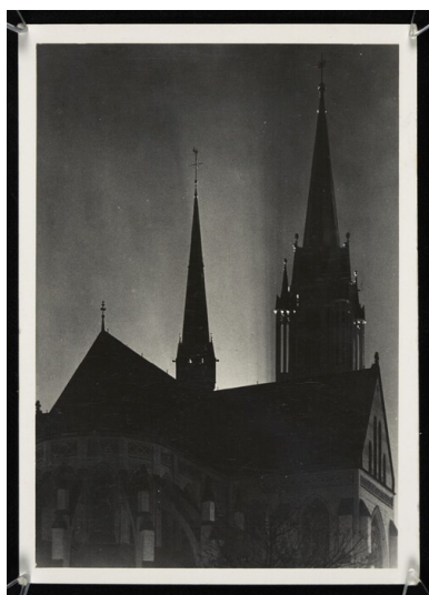
Łódź, katedra pw. św. Stanisława Kostki. (pocztówka wydana w Polsce, we Lwowie, w 1939 r.).

zarówno alumnów, jak i wykładowców. Poinformowali też wszystkich kleryków oraz władze o zamknięciu seminarium. Listy sporządzone wówczas przez gestapo zostały wykorzystane podczas aresztowań, jakie miały miejsce dwa miesiące później, w kwietniu 1940 r. Uwięziono wtedy dziewięciu alumnów, których zwolniono dopiero po kilku tygodniach. Pozostali uniknęli aresztowania dzięki temu, że przeczuwając zamiary niemieckich władz okupacyjnych podali gestapowcom fałszywe miejsca zamieszkania.