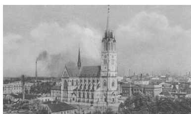
Panorama Łodzi z katedrą pw. św. Stanisława Kostki, okres Drugiej Rzeczypospolitej.

Kraj Warty zajmował specyficzne miejsce w nazistowskiej polityce narodowościowej. Będąc największym z regionów przyłączonych do III Rzeszy traktowany był jako miejsce przeprowadzania eksperymentów. Za politykę narodowościowo-wyznaniową na „ziemiach wcielonych” odpowiadał namiestnik Kraju Warty Arthur Greiser, który od samego początku swoich rządów dążył do utworzenia na tym terenie Mustergau – okręgu wzorcowego. Służyć temu miało uregulowanie pod tym kątem wszelkich aspektów życia społecznego, gospodarczego, a przede wszystkim wyznaniowego. Ta konsekwentna polityka okupanta już od samego początku charakteryzowała się germanizacją Łodzi, doprowadzając do ogromnych zmian w narodowościowej i wyznaniowej strukturze miasta.