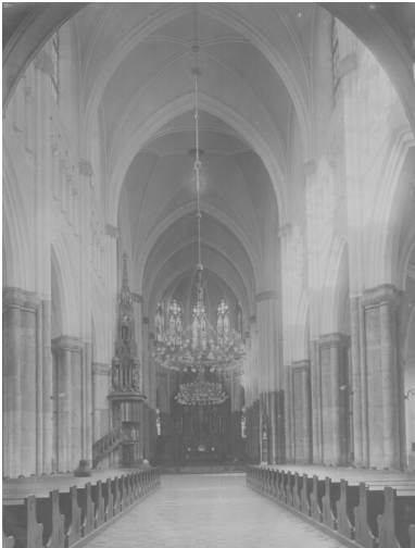
Nawa główna katedry pw. św. Stanisława Kostki w Łodzi, okres Drugiej Rzeczypospolitej.