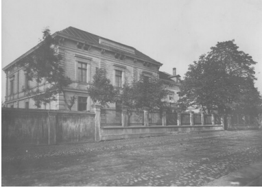
Widok zewnętrzny Seminarium Duchownego w Łodzi, okres Drugiej Rzeczypospolitej.